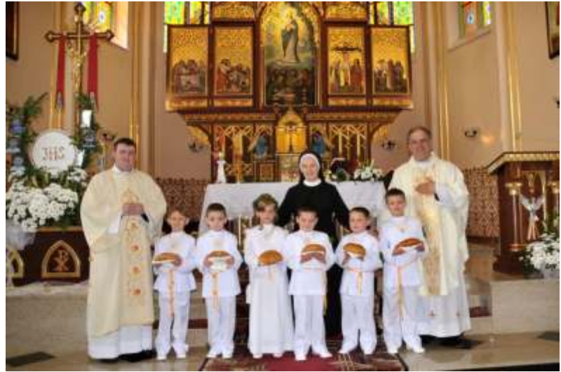
Wczesna Komunia wi ta