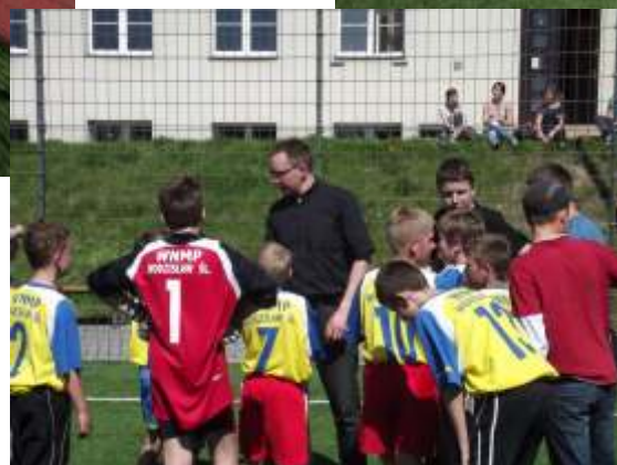
Turniej piłki no nej ministrantów