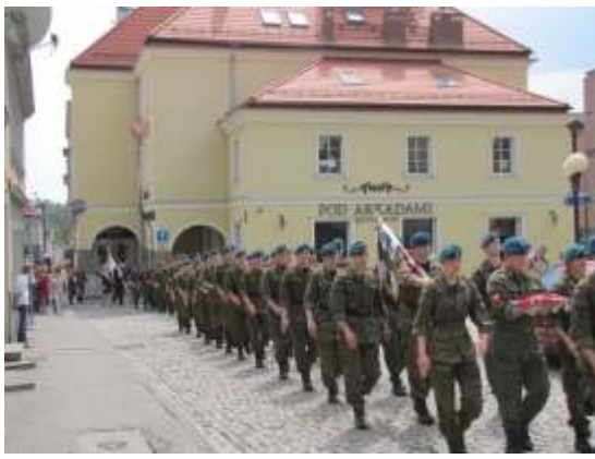
Uroczysto ci z 3 maja